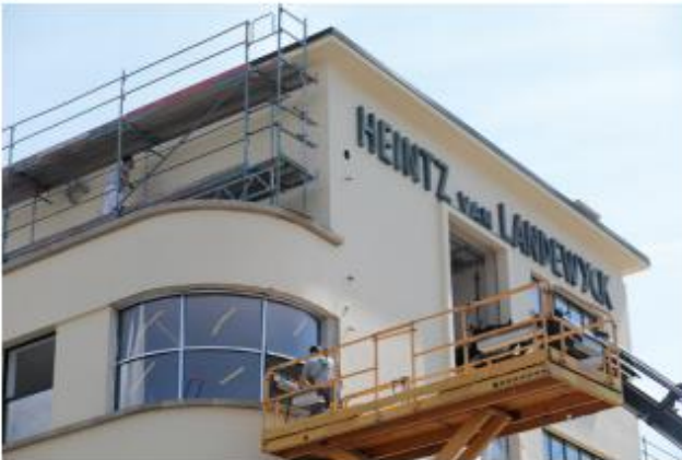
Les travaux du Landewyck Building sont dans la dernière ligne droite avant l'imménagement des locataires en novembre.