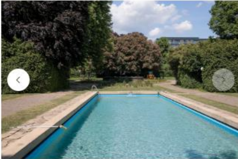
Aujourd'hui, une piscine en plein air est encore utilisée. À terme, elle ne pourra plus l'être et sera comblée.