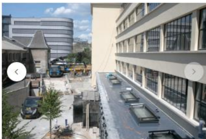
Au-dessus de la nouvelle extension, des ouvertures zénithales ont été ajoutées pour apporter un maximum de lumière naturelle à l'intérieur.

Aujourd'hui, les annexes ajoutées au fur et à mesure des années sont démolies et la façade côté parc est à nouveau dégagée. Le bâtiment retrouve ainsi son dessin original avec ses grands bandeaux horizontaux de fenêtres.