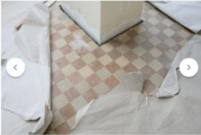
Certains sols sont conservés.