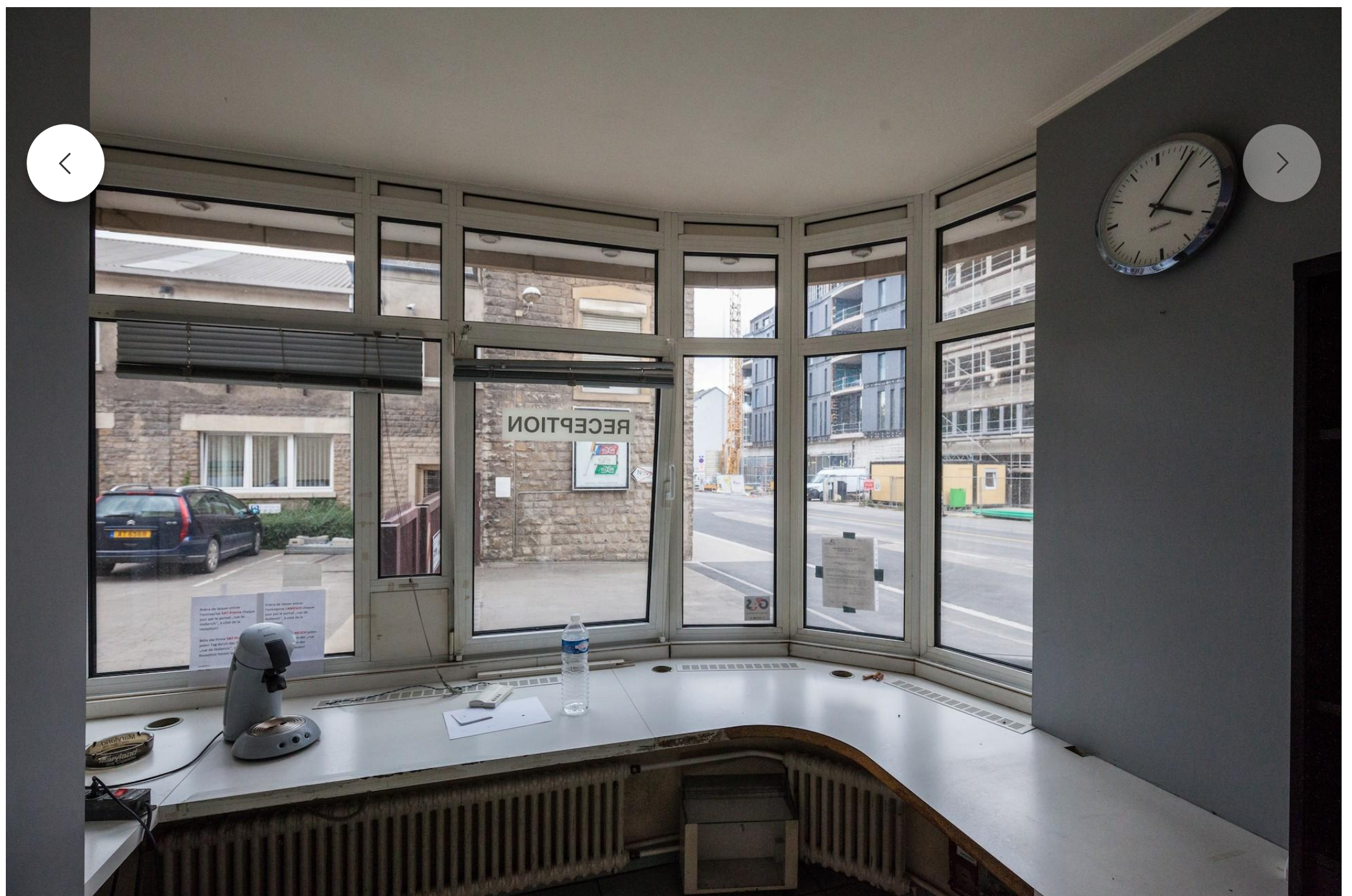
Vue intérieure du bâtiment avant transformation.