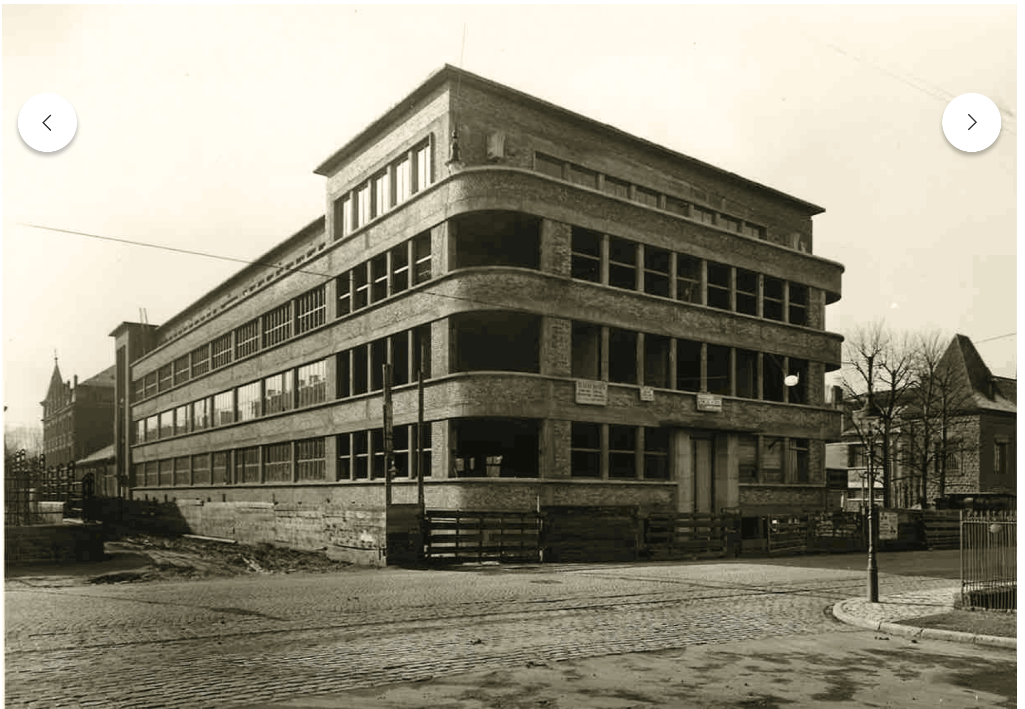
Vue de l'immeuble pendant sa construction.